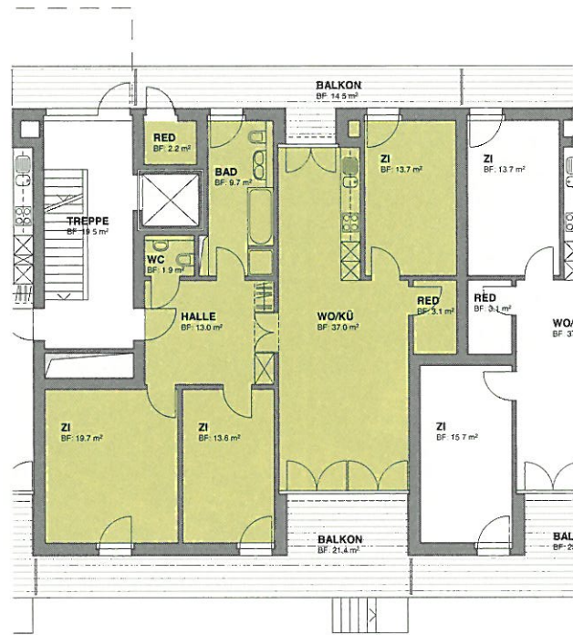
Grundriss 4 1 / 2 -Zimmer-Wohnung

In nur ca. 15 Minuten gelangt man mit den städtischen Bussen, die praktisch vor der Haustüre (an der Hedy-Hahnloser-Strasse) anhalten, zum Winterthurer Hauptbahnhof bzw. nach Töss mit guten Einkaufsmöglichkeiten. Die Autobahneinfahrt Töss ist in beide Richtungen (Richtung Zürich oder St. Gallen/Frauenfeld) bequem in zwei bis drei Minuten erreichbar. Immer wieder beliebt ist auch der Weg über Nürensdorf/Breite Richtung Zürich-Nord und Flughafen.